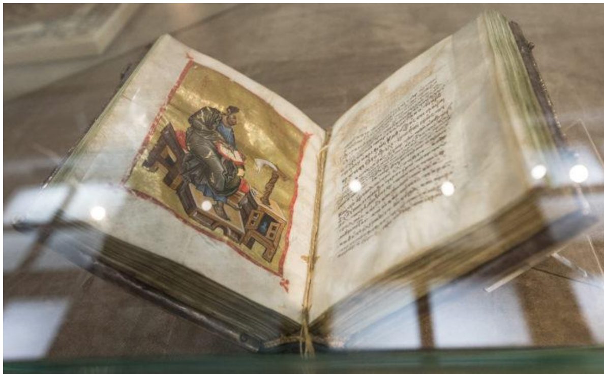
Рукопись. С выставки «Шедевры Византии» .

— Бытует мнение, что византийская икона никогда не отражала реалии той или иной эпохи. Что по ней, например, нельзя узнать, как одевались византийцы, в каких домах жили и так далее. Это так?