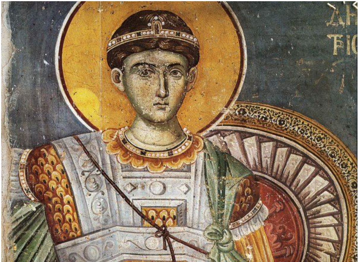
Димитрий Солунский, св. вмч.; Византия.; XIV в.

Такое внимание к книжной культуре в Византии неслучайно. Практически на протяжении всей истории империи влияние интеллектуальной элиты было очень весомым. Бывало, что трон занимали императоры, которые покровительствовали наукам, культуре, книжному делу. На личные средства они заказывали в скрипториях манускрипты, которые затем дарили монастырям.