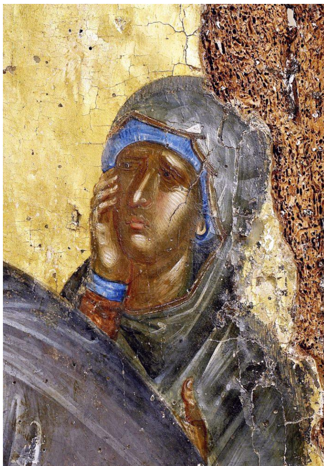
Фрагмент византийской иконы, на котором видны высветленные элементы. Снятие со креста; XIV в.; Византия

Язык, на котором говорит византийское искусство, безусловно наполнен символами, которые нужно уметь расшифровывать. Но иначе нельзя было решить такую грандиозную задачу: изобразить то, во что человек верит, то есть нечто принципиально невидимое, нематериальное.