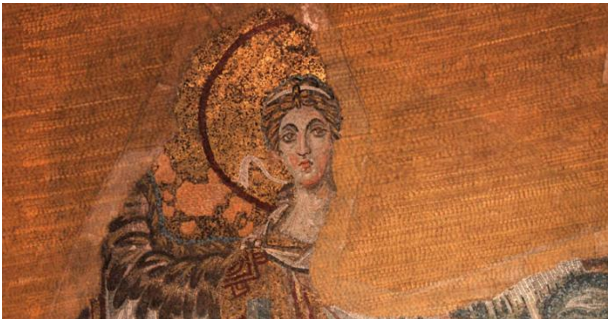
Фрагмент мозаики с изображением архангела Гавриила. Храм Святой Софии. IX век

А вот классический византийский образ не обладает такой «литературностью», и в этом его величайшее значение: в своей предельной простоте византийская икона достигала глубочайшей степени выразительности.