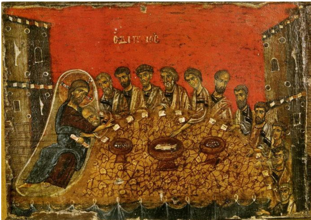
Тайная вечеря. Фрагмент эпистилия темлона; XII в.; Византия.

— Реализма. Натуральным, природным, естественным здесь никогда не интересовались. Все свои образы византийские художники создавали над натурой, как бы минуя материальное и прорываясь к вечному. Можно сказать, что они изображали не сами материальные предметы, а божественные «идеи» о них. Нет в византийском искусстве и резкости движений, динамики — здесь все упорядоченно, гармонизированно, созерцательно.