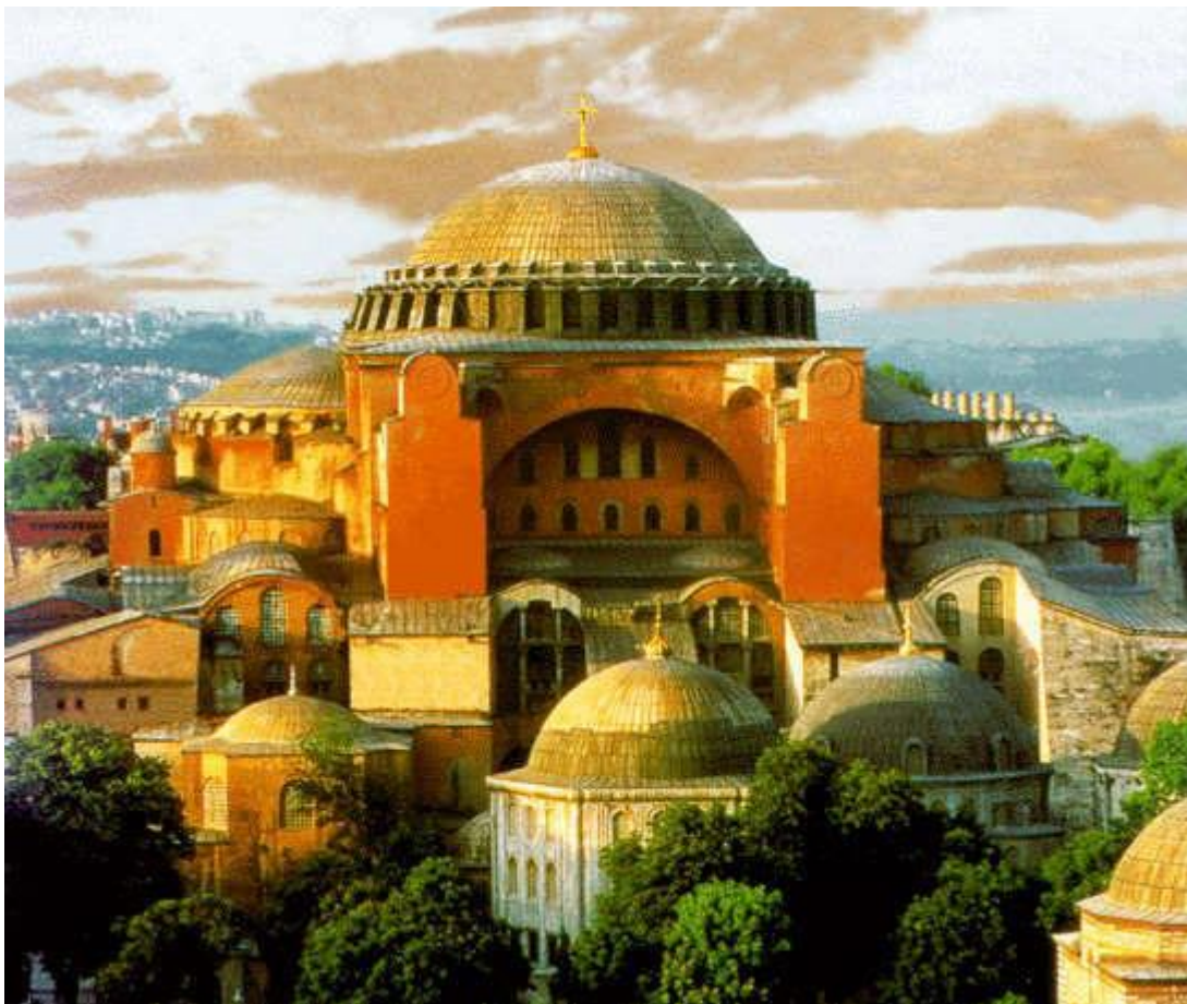
Собор святой Софии в Константинополе

— А храм для византийцев был только центром религиозной жизни?