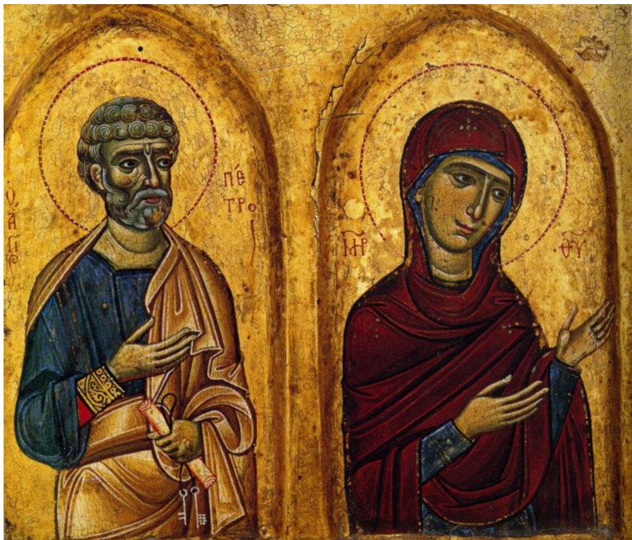
Деисус; XIII в.; Византия

Когда отцы Церкви сформулировали догмат о Боговоплощении, антропоморфное искусство (ориентированное на изображение человека. — Прим. ред. ), на котором стояла античность, стало допустимым и в христианском мире. И произошел удивительный сплав, в котором античная форма наполнилась абсолютно новым, христианским содержанием.